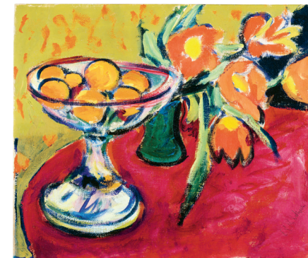
Ernst Ludwig Kirchner, Stilleben mit Orangen und Tulpen , 1909