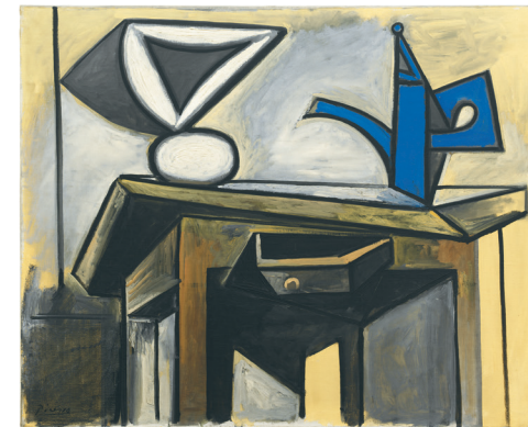
Pablo Picasso, Nature morte à la cafetière , 1947 © Succession Picasso/2020, ProLitteris, Zürich