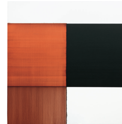
Callum Innes, Exposed Painting Crimson Red , 2014 © Callum Innes