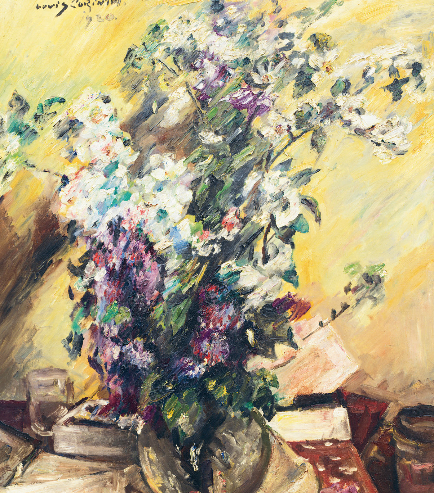
Lovis Corinth, Apfelblüten und Flieder, 1920 (Detail)